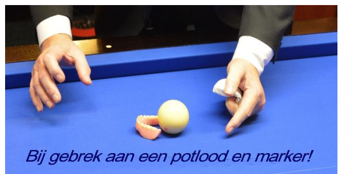
Bij gebrek aan een potlood en marker!

Een speler is bezig aan een serie, hij/zij heeft 121 caramboles en vraagt aan de arbiter om alle ballen even te poetsen. De arbiter tekent de positie van de ballen af, poetst deze op de correcte manier en plaatst de ballen weer terug op de tafel. Vervolgens annonceert hij naar de speler die weer aan de tafel komt zijn totaal aantal gemaakte caramboles, dus 121 en niet alleen de 21 caramboles na de 100 waarna hij de ballen liet poetsen. Maakt hij weer een carambole dan gaat de arbiter weer verder met 22.